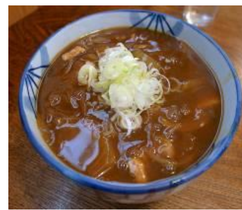
写真はあくまでイメージです。ご提供するものとは異なりますのでご了承下さい

麵食いめぐり「カレーうどん」 カレーうどん発祥と言われる店は、東京に2つあります。一つは早稲田大学近くの「三朝庵」もう一つは、中目黒の「朝松庵」です。 三朝庵は、江戸時代創業の蕎麦屋さんで、カレーうどんは明治三十七年頃に発明されました。 一方、中目黒の朝松庵は、明治創業の蕎麦屋さん。朝松庵は「カレー南蛮蕎麦」を発明した店で、それは明治四十一年頃のことです。 洋食屋さんが盛んになった事に危機感を感じてカレーライスに対抗するために生まれたのが「カレーうどん」だったそうです。