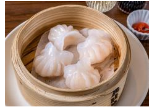
写真はあくまでイメージです。 提供するものとは異なりますのでご了承下さい

「えび蒸し餃子」は広東料理の代表的なひとつです。浮き粉と片栗粉を合わせて作る皮が、蒸すとプルプルに仕上がるのが特徴。えびシウマイとは違ったえび蒸し餃子の食感を、お楽しみください。