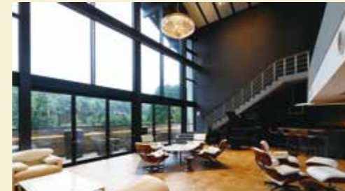
アークユ芦野倶楽部 オーナースalon「アダマス」