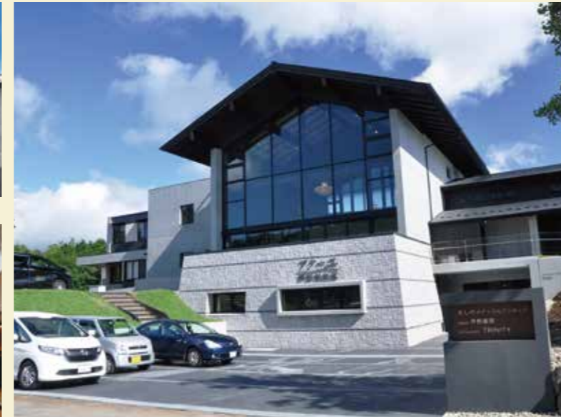
アークユ芦野倶楽部 外観