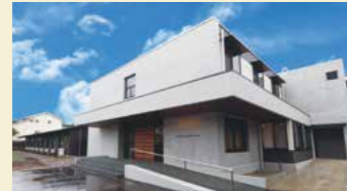
アークユ芦野倶楽部 ゲスト専用エントランス

そこでは新たな交流が生まれ、仲間と趣味を愉しみ、笑顔あふれるくつろぎの日々が続いていく。上質で多様な共用空間と、専属シェフが振る舞う那須拘りのお食事。バーラウンジではグランドピアノを聴きながら、ウイスキーやカクテルなども堪能できます。また併設のクリニックや介護体制も整っているので、ライフスタイルが変わる将来も安心です。施設の前には「現代の湯治場」として全国的に有名な芦野温泉があり、健康増進・維持のために連携した運営を行っています。「安心」「安全」「快適」が揃うこの場所で、やすらぎの日々を送りませんか。